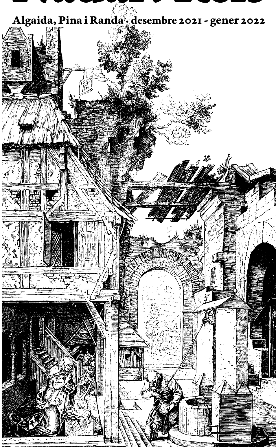
La Nativitat (1504) gravat d'Albrecht Dürer (Nuremberg, 1471-1528)

Algaida, Pina i Randa · desembre 2021 - gener 2022